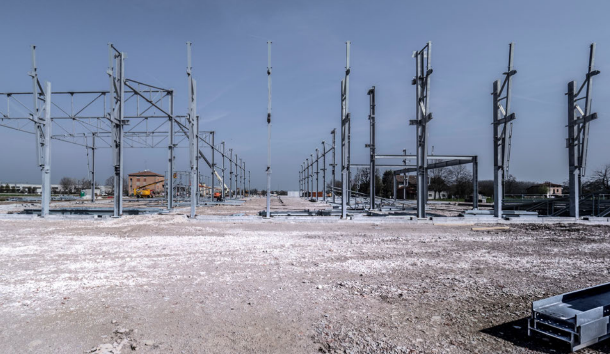
Installazione delle strutture in carpenteria metallica