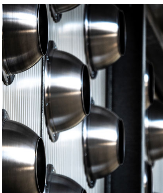
Particolari dell'impianto di trattamento aria