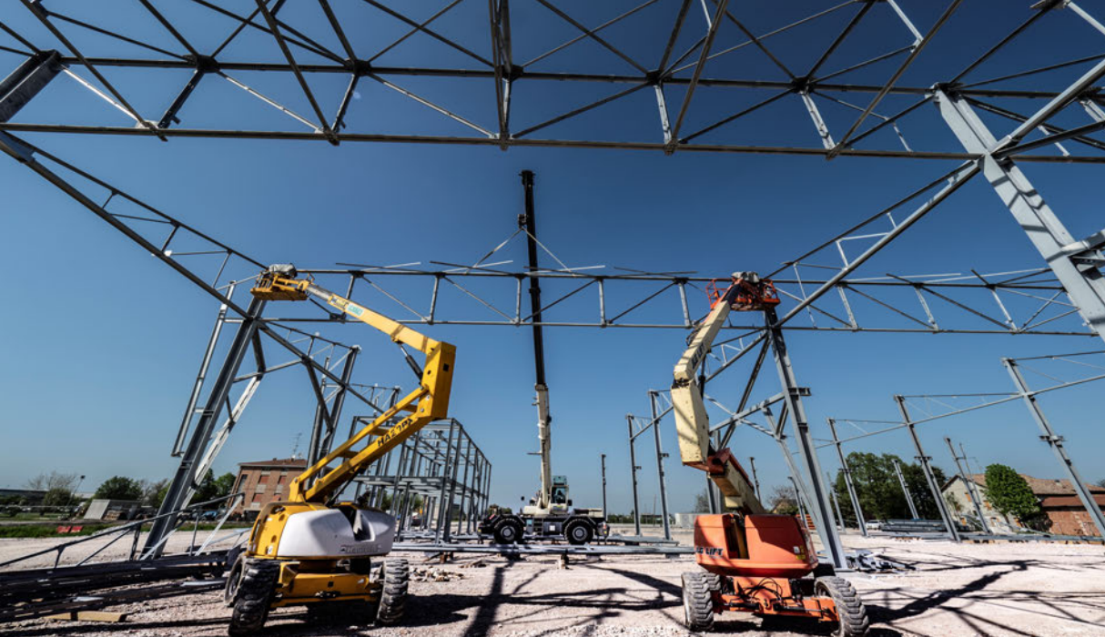
Installazione delle travi reticolari in carpenteria metallica