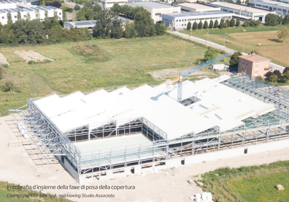
Fotografia d'insieme della fase di posa della copertura