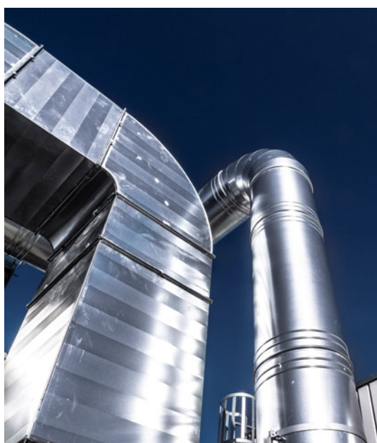
Impianti di aspirazione presenti nell'apposito soppalco scoperto